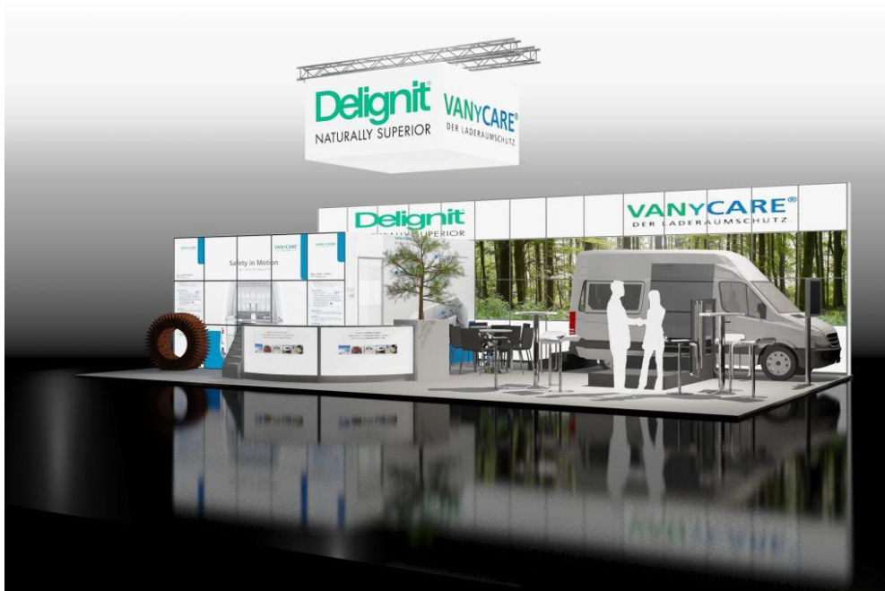
Abbildung 1 Messestand IAA 2012 Halle 13 Stand E 40

Delignit AG Presse und Öffentlichkeitsarbeit – Nicole Schröder Königswinkel 2 D-32825 Blomberg Telefon: 0 52 35 / 9 66 – 119 Telefax: 0 52 35 / 9 66 – 351 Internet: http://www.delignit.com E-Mail: nicole.schroeder@delignit.de