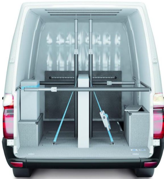
Abbildung 4 VANYCARE ® -Komplettausstattung incl. Ladungssicherungssystem mit Sperrstange, Zurrschienen und Gurten